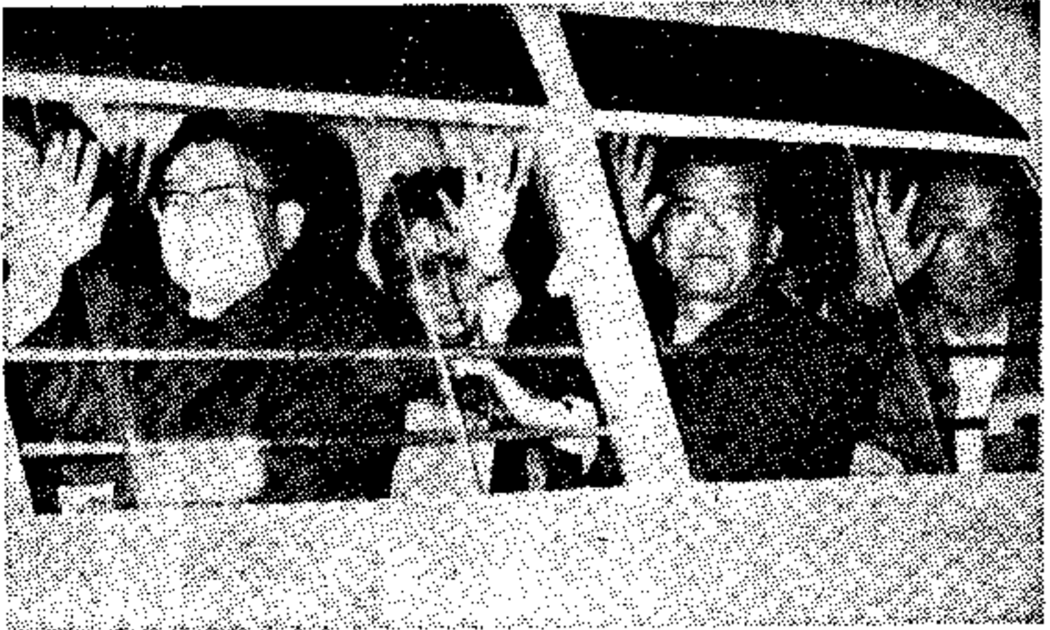
Χορομένον διά την άσπίαν λήξην της 30 ώρον περιπέτειας του, μερικοί Ισπανοί εκ τών έπιβατιών του όλλανδικού ελτιμου έκταθείσαν διά έλεωφροσύνην τόν άεροδρόμιον της Μάλτας μετά την άποβήσιν τών ύπών τών Αράβων άεροπλανητών. (Τηλεφωτ. ΑΠΕ — U.P.I.)