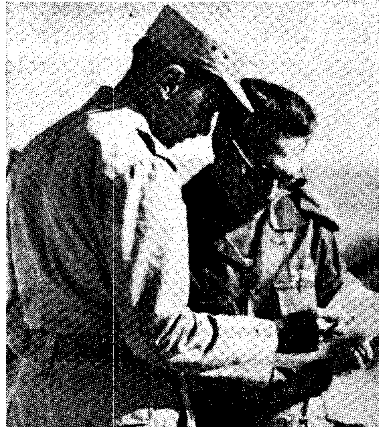
Οι στρατηγοί Μαχμάντ Γκαμού της Αιγύπτου (αριστερά) και Αχχαρν Γκαρίρ του Ισραήλ, μελετούν κάποιο έγγραφο κατά την χθεσινή νέον συνάντησιν των εις το 101ον χιλιόμετρον της οδού Καίρου — Σουξ, (Τηλεφωτογραφία: Α.Π.Ε. — U.P.I.)